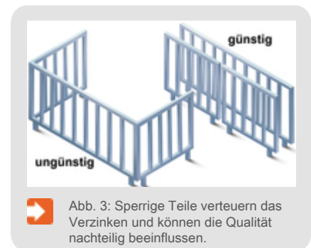
Abb. 3: Sperrige Teile verteuern das Verzinken und können die Qualität nachteilig beeinflussen.

Zweidimensionale Konstruktionen lassen sich wirtschaftlicher verzinken als dreidimensionale Konstruktionen (Abb. 3). Große, abgewinkelte (dreidimensionale) Konstruktionen erhöhen die Verzinkungskosten, da Traversen während des Feuerverzinkens nicht optimal genutzt werden können. Die Verzinkungsqualität kann zudem nachteilig beeinflusst werden. Konstruktionen sollten daher möglichst zweidimensional geplant werden.